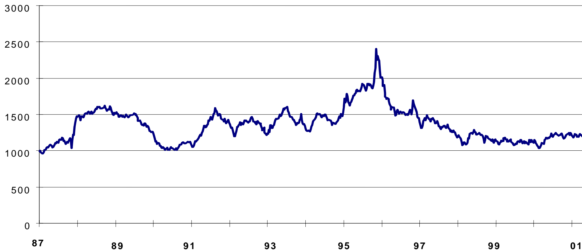
GRÁFICO 2 ÍNDICE DE LOS PRECIOS DEL TRIGO SEGÚN EL CONSEJO INTERNACIONAL DE CEREALES, ENERO 1987-OCTUBRE 2001

* Promedio de las siete variedades de trigo panificable objeto de intercambios importantes: julio/diciembre de 1986=1.000.